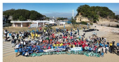
田ノ代海岸（淡路島 淡路市 岩屋）