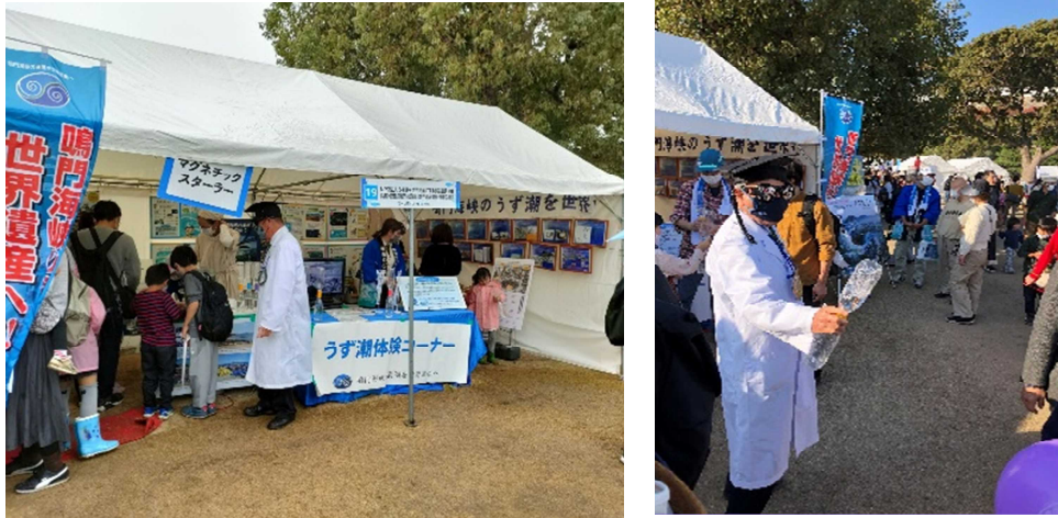
【豊かな海づくりフェスタの様子】