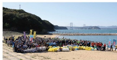
伊弉海岸（淡路島 南あわじ市 阿那賀）