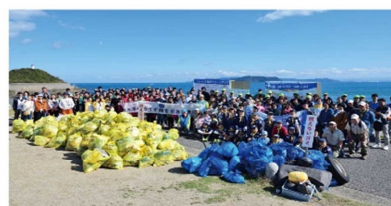
生石海岸（淡路島 洲本市 由良）