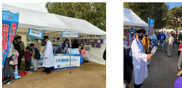
【豊かな海づくりフェスタの様子】