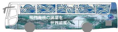
【ラッピングバスデザイン】

令和2年度から運行を開始した渦潮のラッピングバスを引き続き大阪・神戸～淡路島間で運行中。