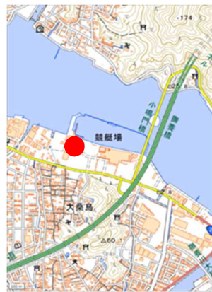
【ボーリング作業地点】

追加の ^{14}\text{C} 年代測定(炭素数を調査することで地層年代を分析する方法)等の分析結果から、約1.05万年前に播磨灘が浅い海として成立していた可能性が高い等のことが判明している。