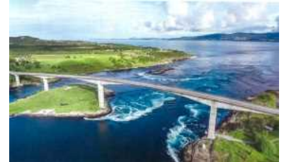
【サルトストラウメン全景】

(ウ) 令和2年度にノード大学と締結した覚書に基づく共同研究の促進を図るために10月にレターを送付し、連絡調整を行っている。