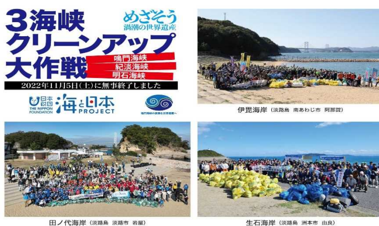
【各会場の集合写真】