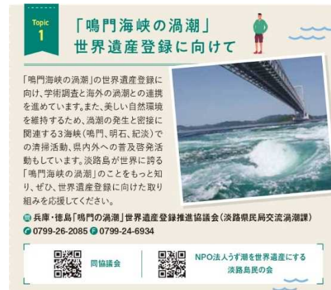
【県民だよりひょうご 12月号抜粋】